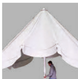
パラソルが開くまで スポークを持ち上げます。