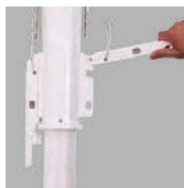
左右のフックをステンレス棒 切り欠きに引っ掛け、ハンドルを 押し下げます。※2段階行います。