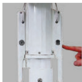
ロックキーを外します。

左右ロックのハンドルを解除し手動にて開閉する方式です。滑らかな軽いタッチで速やかに開閉でき、故障の少ない構造です。