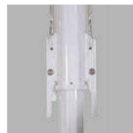
ロックキーを取り付けます。