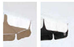
ベージュ (Whiteのみ) ブラック (全色)