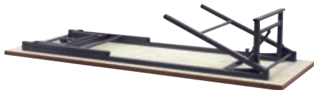
折りたたんだ状態