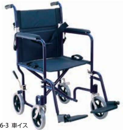
11-436-3 車イス ¥ 56,000 (W665・D1,050・H870)