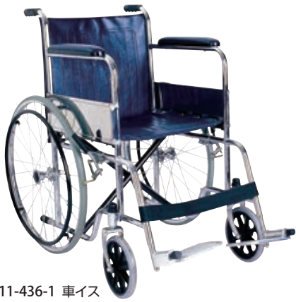
11-436-1 車イス ¥ 40,000 (W630・D1,070・H865)