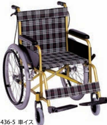
11-436-5 車イス ¥ 77,600 (W665・D1,060・H870)