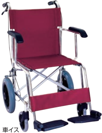
11-436-4 車イス ¥ 56,400 (W660・D980・H870)