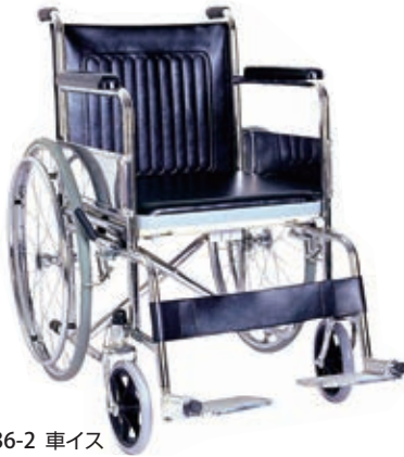
11-436-2 車イス ¥ 52,000 (W670・D950・H885)