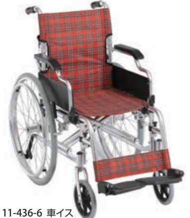
11-436-6 車イス ¥ 92,000 (W670・D980・H865)