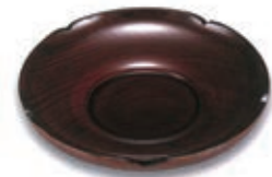
11-189-20 4.0 茶托 梅型 木地呂 ¥ 1,900×5 (120φ・H20)