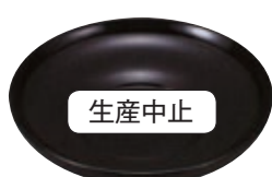
11-189-26 3.5 茶托 だるま 黒 ¥ 2,200×5 (102φ・H20)