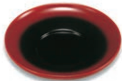
11-189-25 4.0 茶托 だるま型 ぼかし塗 ¥ 2,000×5 (120φ・H20)