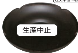
11-189-22 4.2 茶托 梅型 黒 ¥ 1,700×5 (125φ・H25)