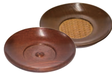
11-189-4 4寸 桃樺細工 茶托 ¥ 800 (120φ)