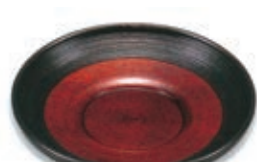
11-189-27 4.5 茶托 玉淵塗分 ¥ 3,400×5 (135φ・H22)