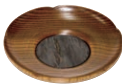
11-189-3 4寸 乱筋茶托 ¥ 720 (120φ)