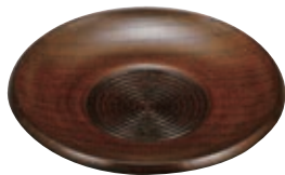
11-189-17 4.0 茶托 百合型筋入 スリ ¥ 1,100×5 (116φ・H20)