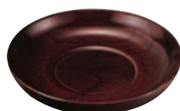
11-189-19 4.0 茶托 鉄鉢型 木地呂 ¥ 1,700×5 (120φ・H20)