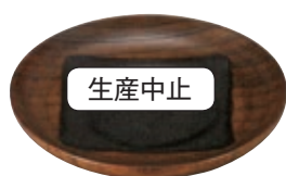
11-189-18 4.2 茶托 布きせダルマ 拭漆 ¥ 1,600×5 (125φ・H20)