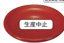
11-189-24 4.0 茶托 縁丸 洗朱 ¥ 2,200×5 (122φ・H20)