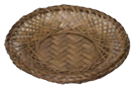
×11-189-1 (生産中止) 3.5寸 雅竹茶托 ¥ 880 (105φ)