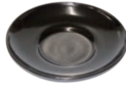
11-189-12 4寸 溜塗り 茶托 ¥ 1,440 (120φ)