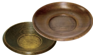
×11-189-7 (生産中止) 3.5寸 千筋茶托 ¥ 640 (120φ)