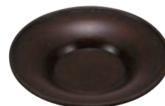
11-189-16 煎茶茶托 すり漆 ¥ 1,300×5 (79φ・H16)