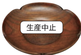
11-189-14 4.0 茶托 梅型千筋 スリ ¥ 1,200×5 (120φ・H20)