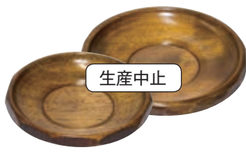
11-189-9 3.5寸 四国彫り 茶托 ¥ 720 (105φ)