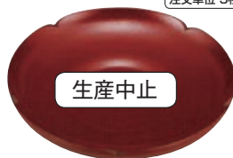
11-189-23 4.2 茶托 梅型 朱 ¥ 1,700×5 (125φ・H25)