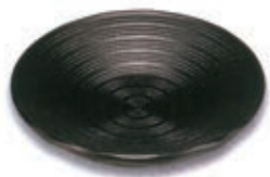
11-189-21 4.2 茶托 亀甲 黒拭漆 ¥ 2,000×5 (125φ・H23)