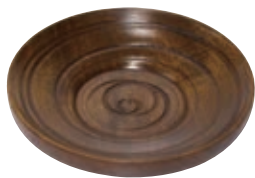
11-189-2 4寸 雅竹茶托 ¥ 960 (120φ)