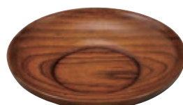
11-189-15 4.0 ダルマ茶托 拭漆 ¥ 1,200×5 (120φ・H20)