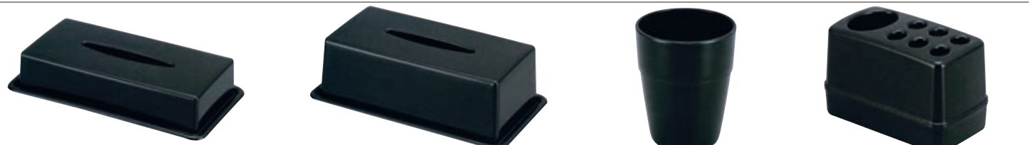
11-180-58 浅型ティッシュBOX(底トレー)ブラック ¥3,180 (W298・D165・H63)