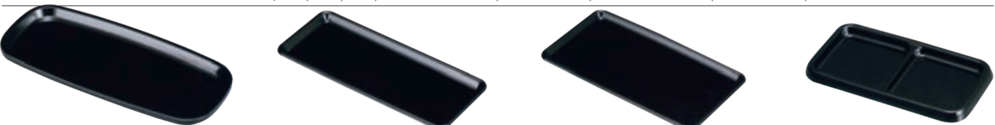
11-180-48 小判トレーブラック小 ¥800 (W224・D122・H17) 11-180-49 小判トレーブラック中 ¥1,100 (W283・D126・H17) 11-180-50 小判トレーブラック大 ¥1,320 (W342・D130・H17)