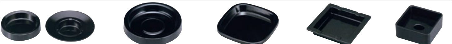
11-180-36 丸灰皿ブラック ¥640 (W105φ・H25) 11-180-37 反り灰皿ブラック ¥600 (W130φ・H30)