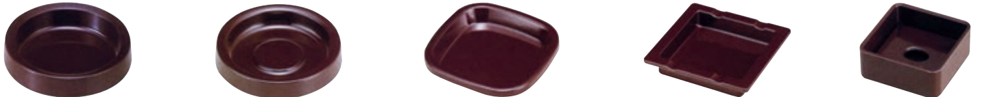
11-180-5 丸灰皿モダンブラウン ¥640 (W105φ・H25)