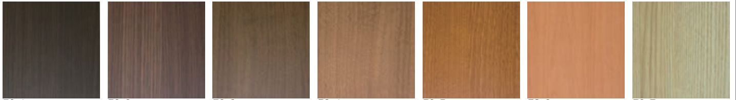
ES-1 オーク A ES-2 オーク B ES-3 ウォールナット A ES-4 ウォールナット B ES-5 チェリー ES-6 メープル ES-7 アッシュ