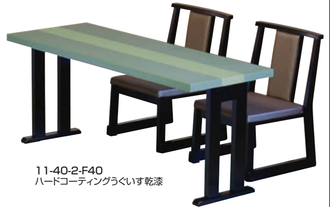
11-40-2-F40 ハードコーティングうくいす乾漆