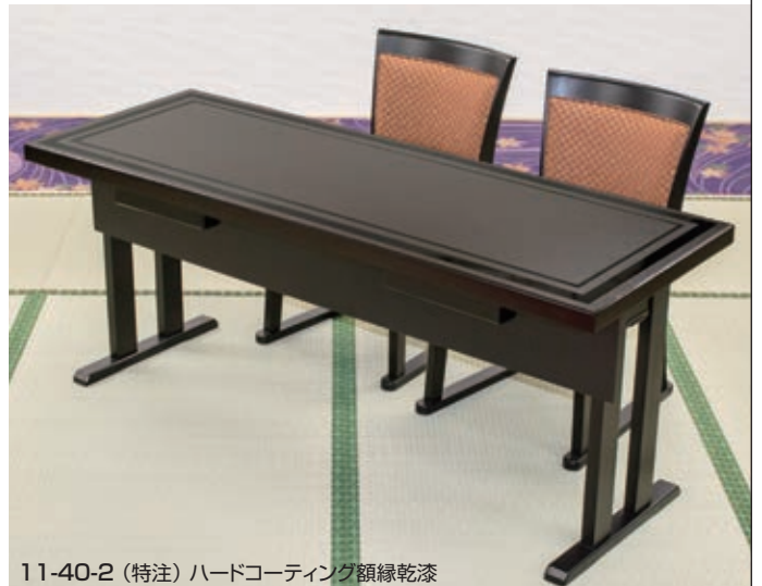
11-40-2 (特注) ハードコーティング額縁乾漆

奥行き D=500・600はD550と同価格です。 高さ H=700の場合は上代プラス3,800円となります。 Fランクの天板裏は黒、側面は同柄塗装、脚部は艶消し黒となります。