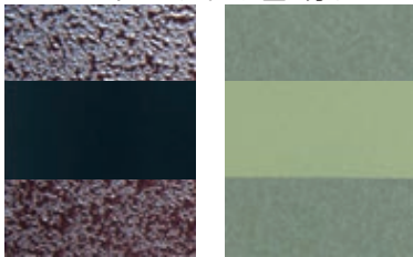
F38 うるみ乾漆/黒鏡面/うるみ乾漆 F39 うくいす乾漆