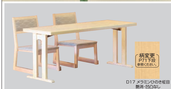
D17 メラミンひのき柁目 艶消・凹凸なし