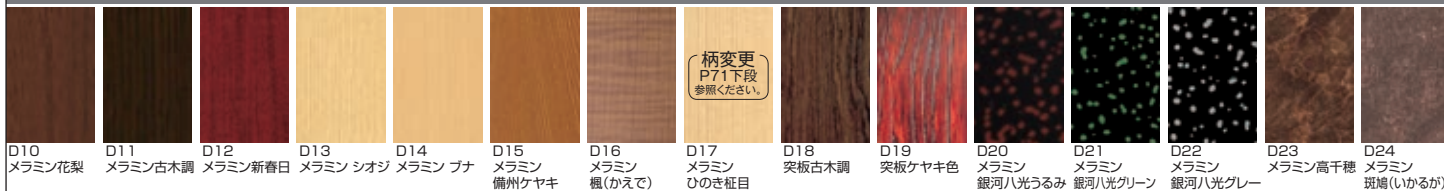
D10 メラミン花梨 D11 メラミン古木調 D12 メラミン新春日 D13 メラミンシヨシ D14 メラミン 枳 D15 メラミン 備州ケヤキ D16 メラミン 楓(かえで) D17 メラミン ひのき柁目 D18 突板古木調 D19 突板ケヤキ色 D20 メラミン 銀河八光うるみ D21 メラミン 銀河八光グリーン D22 メラミン 銀河八光グレー D23 メラミン高千穂 D24 メラミン 斑鳩(いかるが)