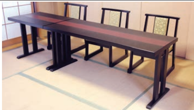
E36 メラミン乾漆調貼り分け 黒/うるみ/黒