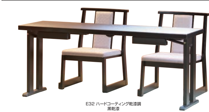
E32 ハードコーティング乾漆調 黒乾漆