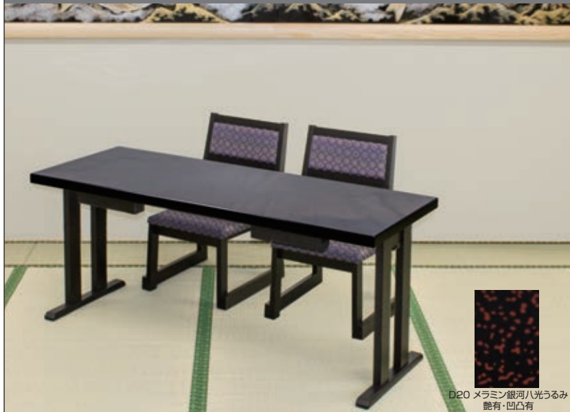
D20 メラミン銀河八光うるみ 艶有・凹凸有