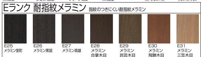
E25 メラミン室町 E26 メラミン黒鼠 E27 メラミン高雄 E28 メラミン 合掌木目 E29 メラミン 民芸木目 E30 メラミン 飛騨木目 E31 メラミン 三笠木目