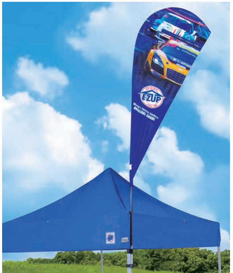
フラッグ [ティアドロップ] 3.7m TDM-20

フラッグブラケット90度 ドリーム・デラックス用 CF-BR090-BK エンデバー・ハブ用 CF-EDBR090-GY