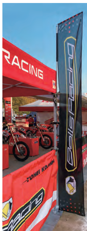
[コーナー] フラッグ ロング 2.98m CFL-10

フラッグブラケット90度 エンデバー・ハブ用 CF-EDBR090-GY ※ドリーム・デラックス用はセットに含まれます。