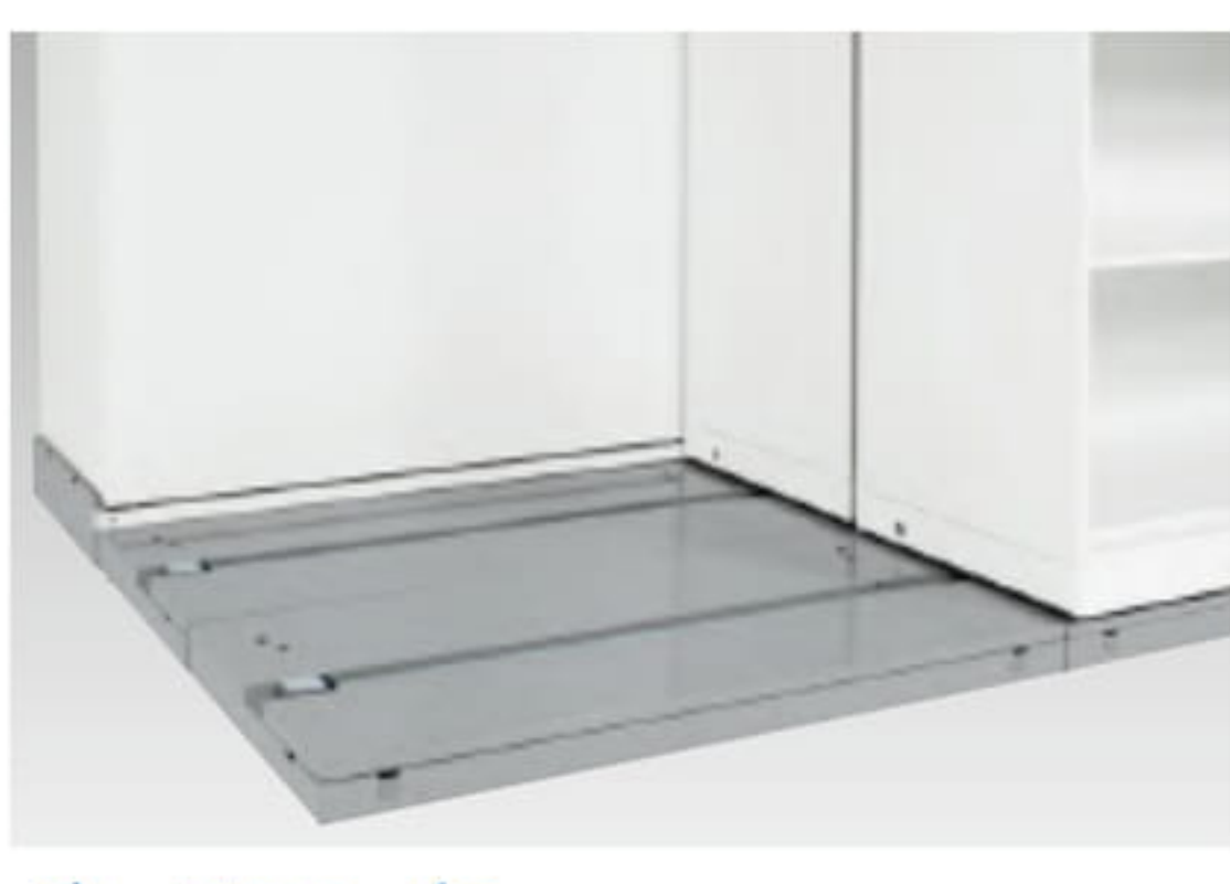
ベースロック 前列書庫を固定、密閉保管も完全です。ご使用に応じ書庫の右にも左にも取り付けができます。また、ベースロックを施錠すると、フルオープンドアも同時にロックがかかるダブルロック構造を採用しています。