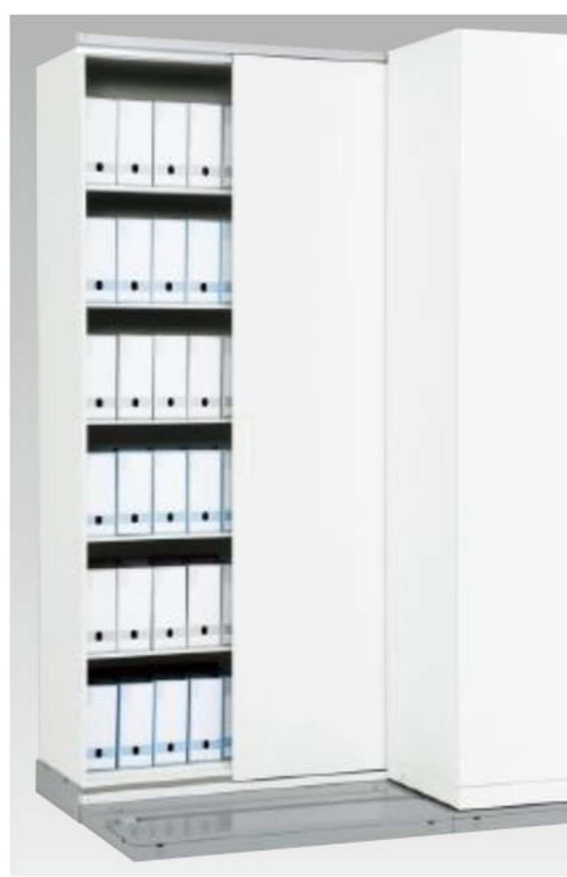
フルオープンドア 後列の固定書庫・オープン型を目隠しするドアです。ベースロックと併用で密閉保管ができます。また後列の奥行最大まで活用できます。