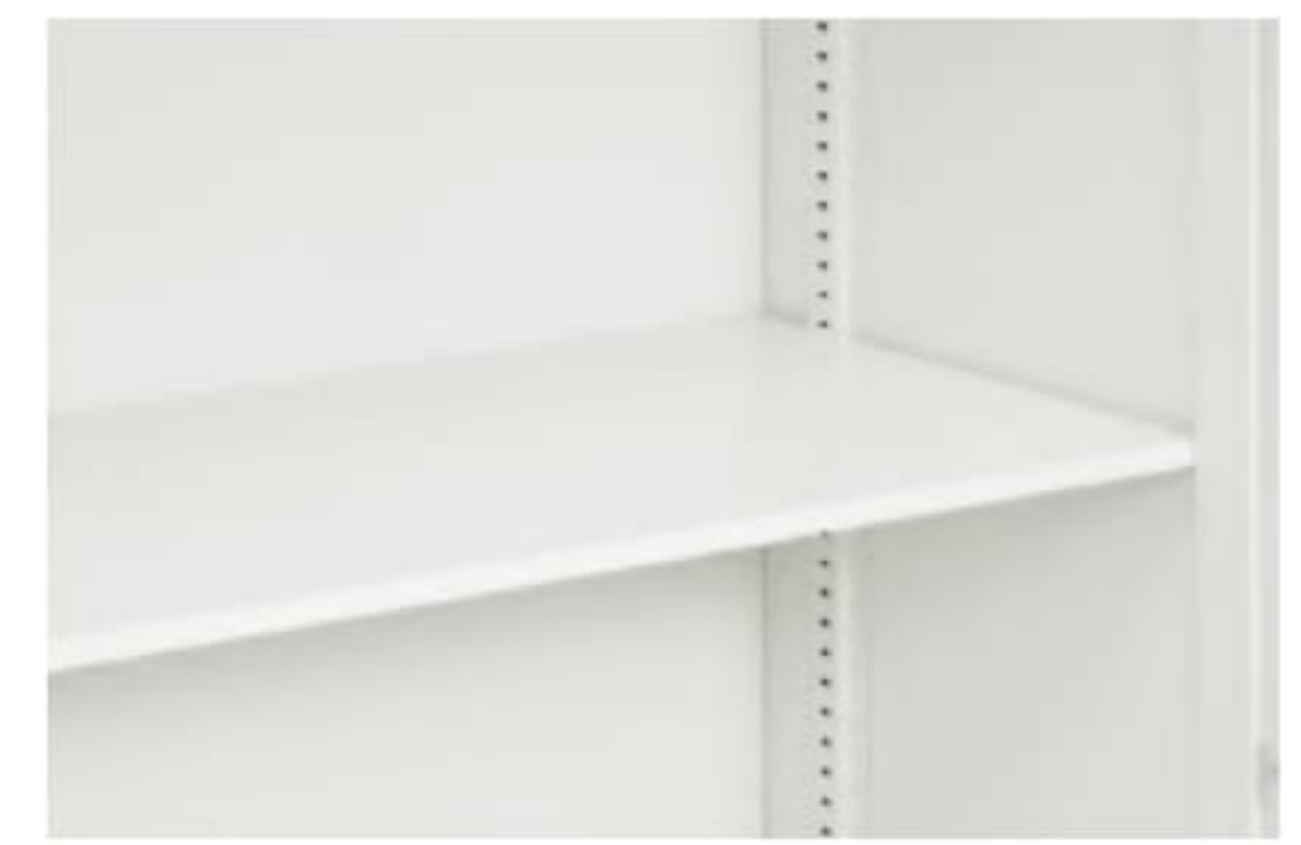
細かい棚ピッチ & 薄型棚板 16.6mm間隔で収納物に合わせて最適な高さ位置に設定できます。厚さ13mmの薄型棚板で収納スペースを最大限に利用します。