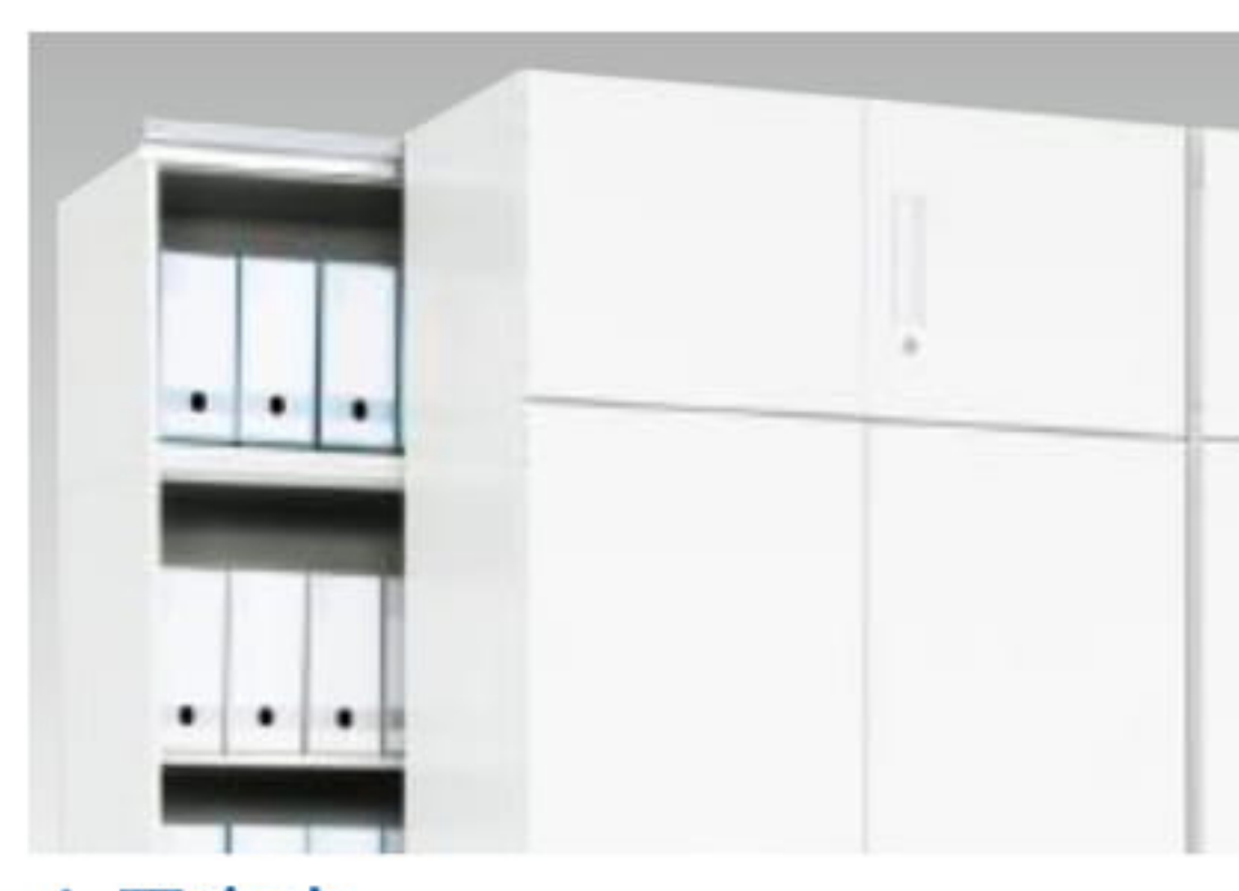
上置書庫 天井いっぱいまで収納スペースとして有効活用できます。