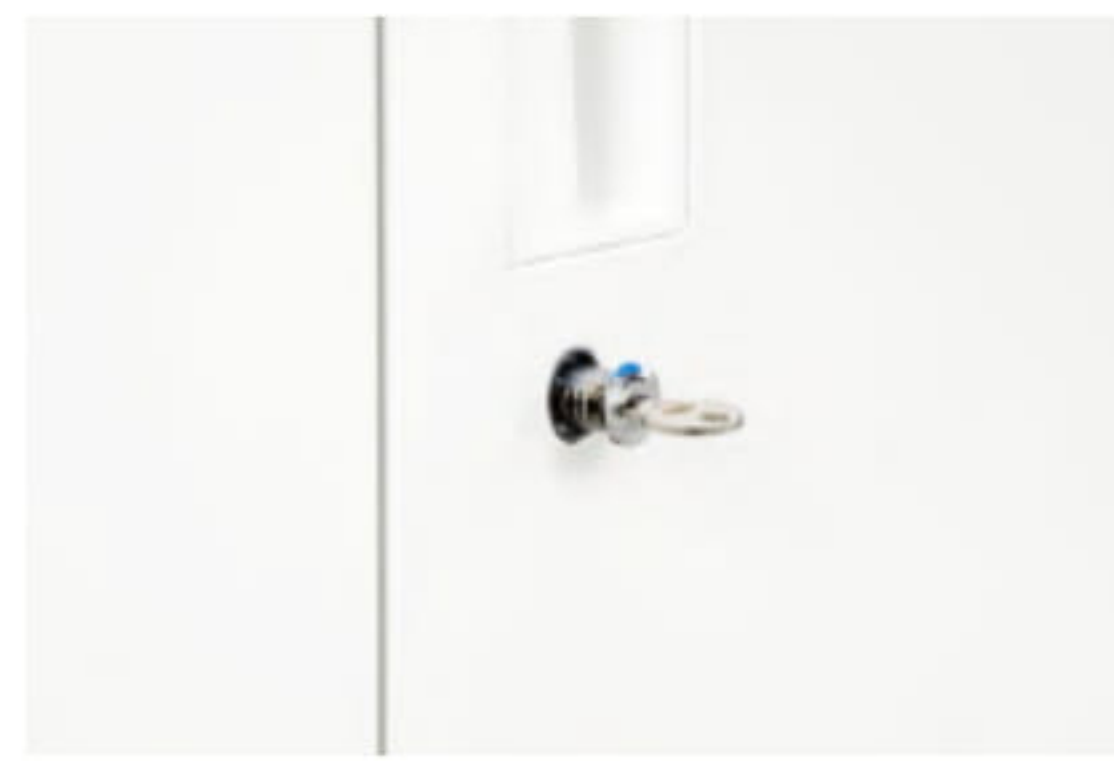
内筒交換錠 専用のチェンジキーで内筒だけを交換することができます。※チェンジキーと交換用内筒セットは別売りです。詳しくはお問合せください。