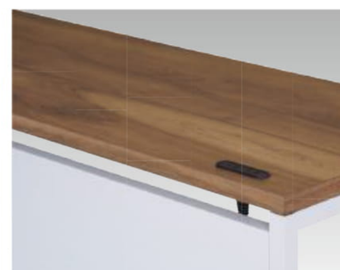
本体：ホワイト(WC)色 天板：アンバーウォールナット(MPB)色