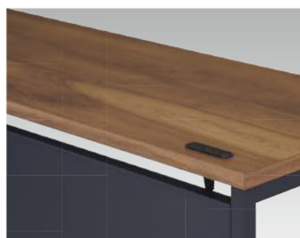
本体：ブラック(BB)色 天板：アンバーウォールナット(MPB)色