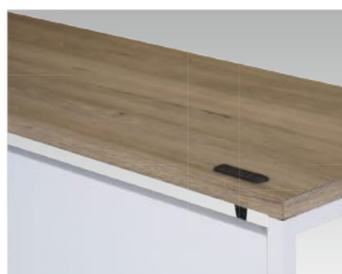
本体：ホワイト(WC)色 天板：ガレットオーク(MPA)色