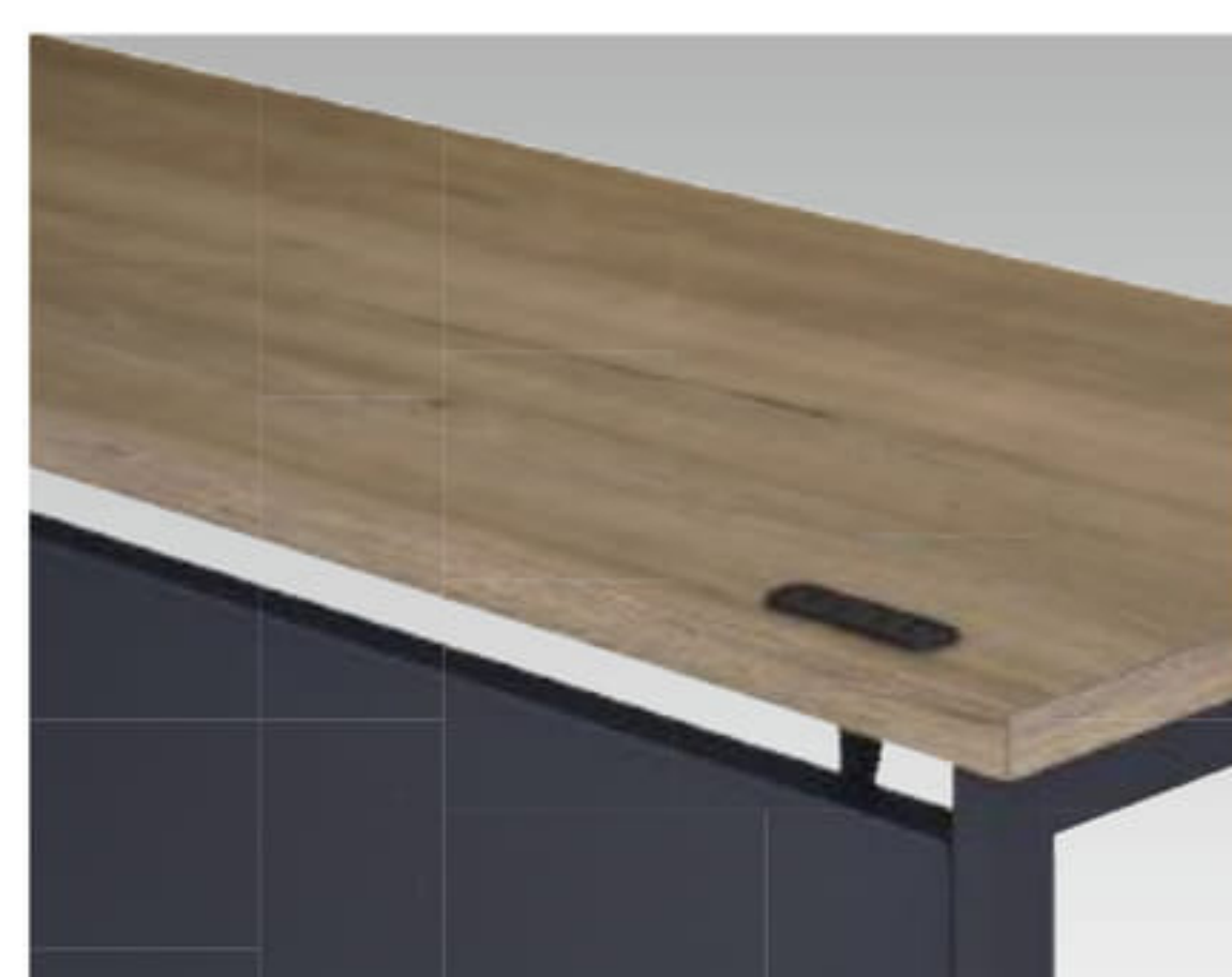
本体：ブラック(BB)色 天板：ガレットオーク(MPA)色