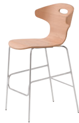
1 CR-MN ¥53,400