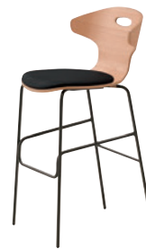
2 DG-MN ¥62,000 レザー・B-15 (No.22)