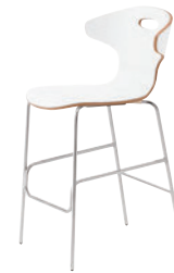
1 CR-MW ¥49,100