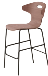
1 DG-MD ¥53,400