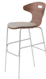
2 CR-MD ¥62,000 レザー・B-15 (No.50)