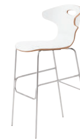
2 CR-MW ¥49,100