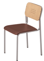
2 SI-MN ¥37,500 レザー・B-25 (No.5)