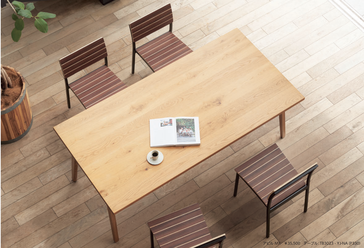
アビル MX ¥35,500 テーブル:TB3023 - YJ-NA (P330)