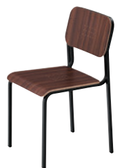
1 BL-MX ¥37,400