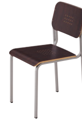
1 SI-MD ¥37,400