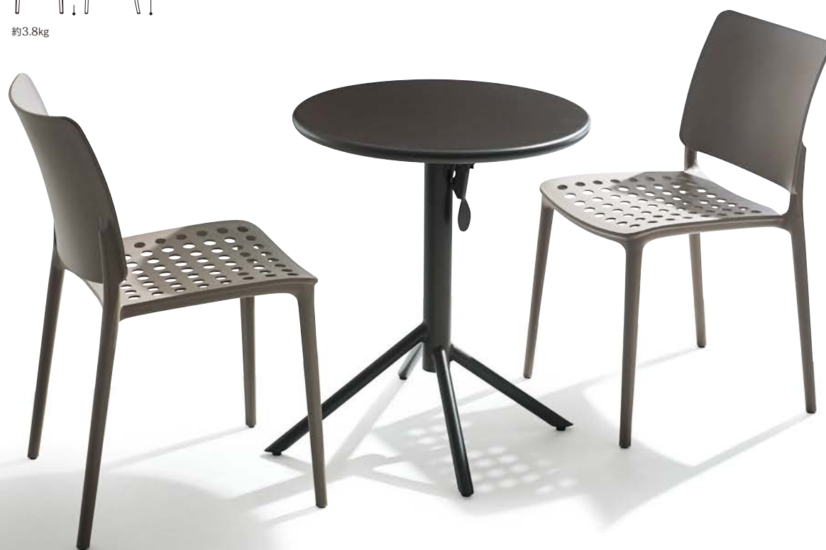
テーブル=ラスティテーブル2型