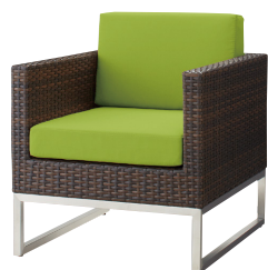
M 張地: サンプル・5429-0000 (GA) ¥157,000