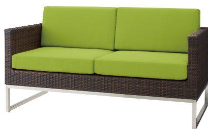
L 張地: サンプル・5429-0000 (GA) ¥272,000