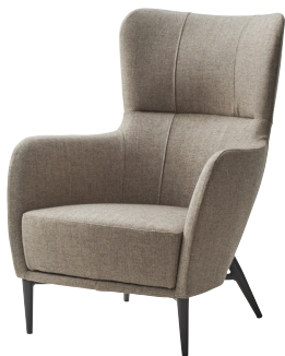
張地: 布・トラッド・TR-2001 (E) ¥144,000