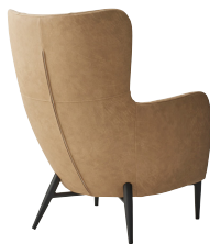
張地: レザー・デニムII・UP870 (B) ¥127,500