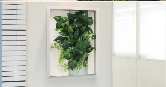
ウォールグリーン

グリーン素材をアレンジ額装したアートパネル。アートのように飾ることができ、オシャレでセンスのいい空間が作れます。