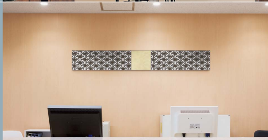
接続アートパネル

雰囲気作りのためのインテリアアートです。布、和紙、ウッドなどの風合いある素材をテーマとした、パブリック向けのアートパネルです。