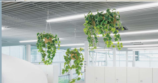
ハンギングポット

ポットを使った自然スタイルのグリーン。壁掛けや卓上などバリエーションが豊富で、グリーンを入れ替えたり、観葉植物も楽しめます。