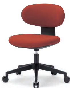
M-4105B (F28) OR