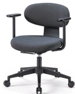
M-4155B (F28) GR