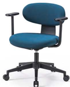
M-4155B (F28) BU