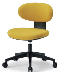
M-4105B (F28) YE