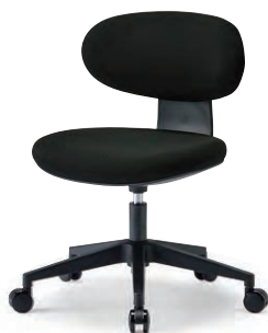
M-4105B (F28) BK