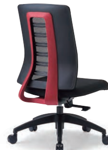
MS-1925RE (F32) BK

MS-1955□□ (F32) BK ¥62,400 W660×D615×H965~1060・ SH420~515