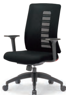
MS-1955RE (F32) BK