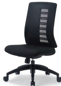
MS-1925BK (F32) BK