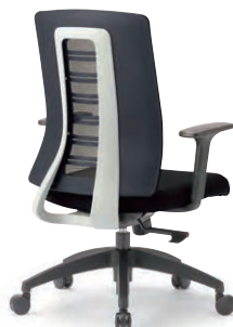
MS-1955GR (F32) BK