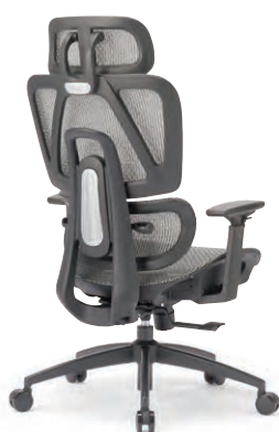
RS-2301 (M21) GR

RS-2301 (M21) □□ ¥83,200 W665×D630×H1125~1200・ SH445~520