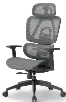
RS-2301 (M21) GR