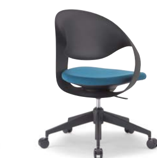
M-2055 (F28) BU