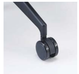
強化ナイロン樹脂成形品 φ60mmウレタン巻双輪キャスター