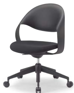
M-2055 (F28) BK