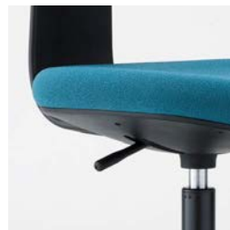
ガス上下調整レバー