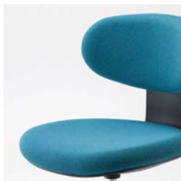
背座モールドウレタンフォーム