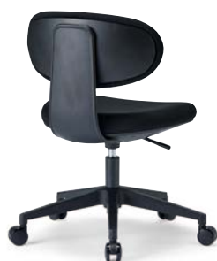
M-4055B (F28) BK