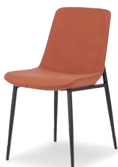
OC-543 (F26) OR