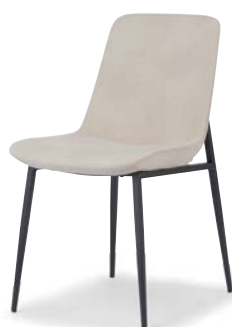
OC-543 (F26) WGR