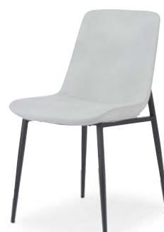
OC-543 (F26) CGR