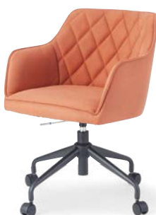
OC-538 (F26) OR