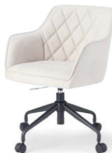
OC-538 (F26) WGR