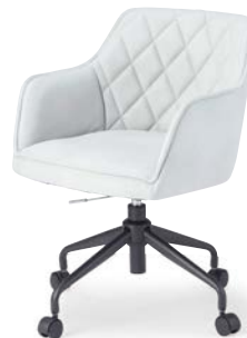
OC-538 (F26) CGR