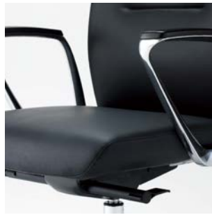
座モールドウレタンフォーム