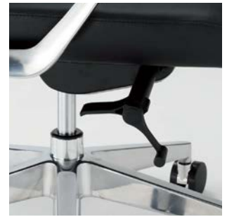
ガス上下調整レバー