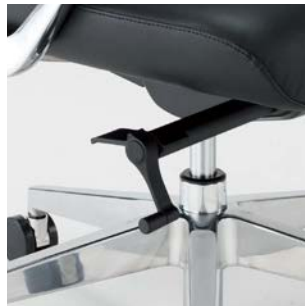
ロック強度調整ノブ