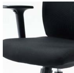
座モールドウレタンフォーム