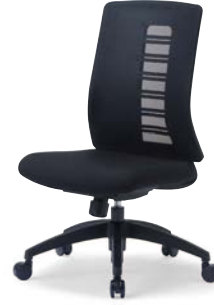
MS-1925 (F32) BK