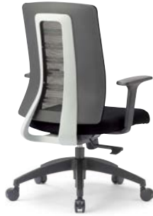
MS-1955 (F32) GR