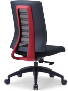
MS-1925 (F32) RE