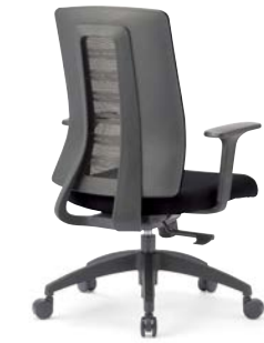
MS-1955 (F32) BK