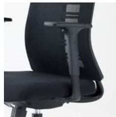
上下可動肘 (8ポジション11mmピッチ)