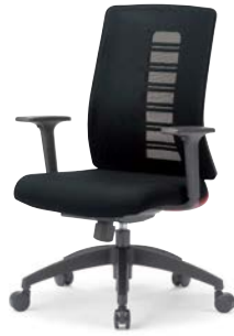
MS-1955 (F32) RE