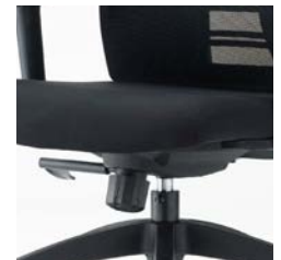
ロック強度調整ノブ