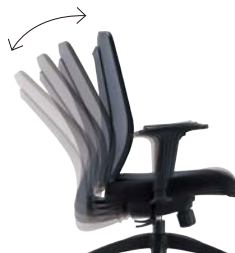
シンクロロック機構