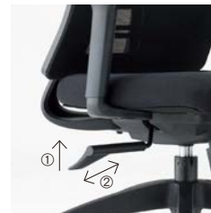
①ガス上下調整レバー ②ロックロックレバー (3ポジション)