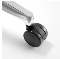
φ60mmウレタン双輪 キャスター