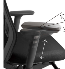
各30°左右可動肘 上下可動肘 (10ポジション11mmピッチ)