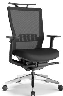
RS-5735 (F10) BK+ハンガー