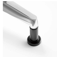
固定脚用プラパート (オプション対応) ¥500