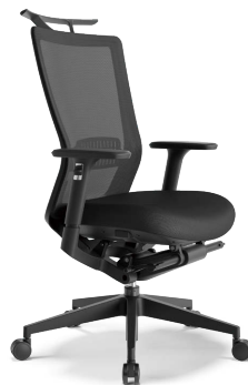
RS-5715 (F10) BK+ハンガー