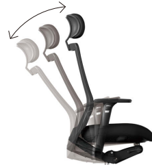
シンクロロック機構