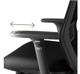
前後可動肘(13ポジション)