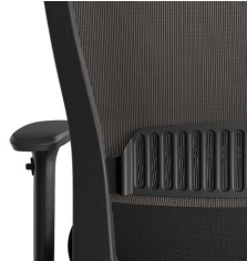
ランバーサポート機構 (7ポジション)