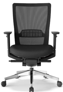
RS-5735 (F10) BK