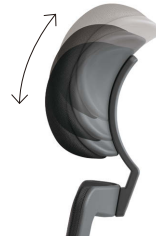
ヘッドレスト調整機構 (7ポジション)