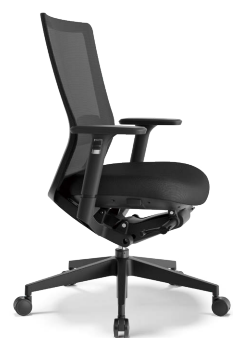
RS-5715 (F10) BK