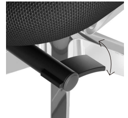
ロックロックレバー (4ポジション)

(F10) 座 / 布張り (M10) 背 / エラストメリックポリエステルメッシュ張り