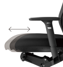
座スライド機構 (7ポジション)