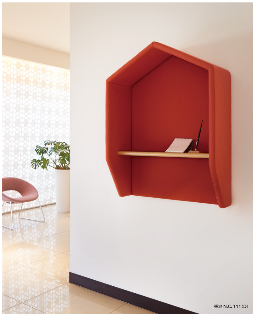
張地 N.C. 111 (D)