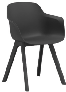
カーボンブラック