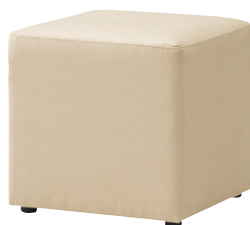
張地 アイコン ICO-5 (A)