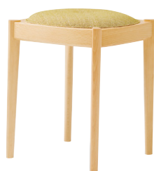
張地 プラハ PU-6 (B)