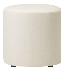
張地 アイコン ICO-1 (A)