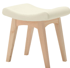
張地 アイコン ICO-2 (A)