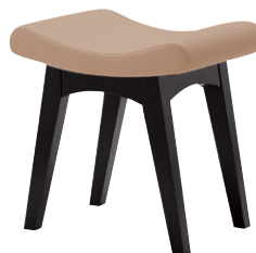
張地 アイコン ICO-7 (A)