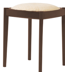
張地 プラハ PU-3 (B)