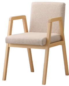
張地 モック 304 (A)