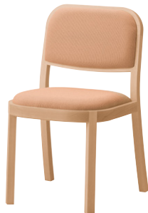
張地 ツイル SPI (C) CL色