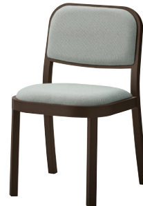
張地 ツイル AS (C) MB色