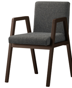
張地 モック 205 (A)