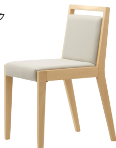
張地 ツイル I (C)