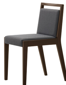
張地 ツイル BK (C)