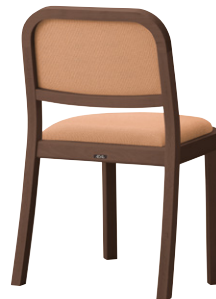
張地 ツイル SPI (C) BR色