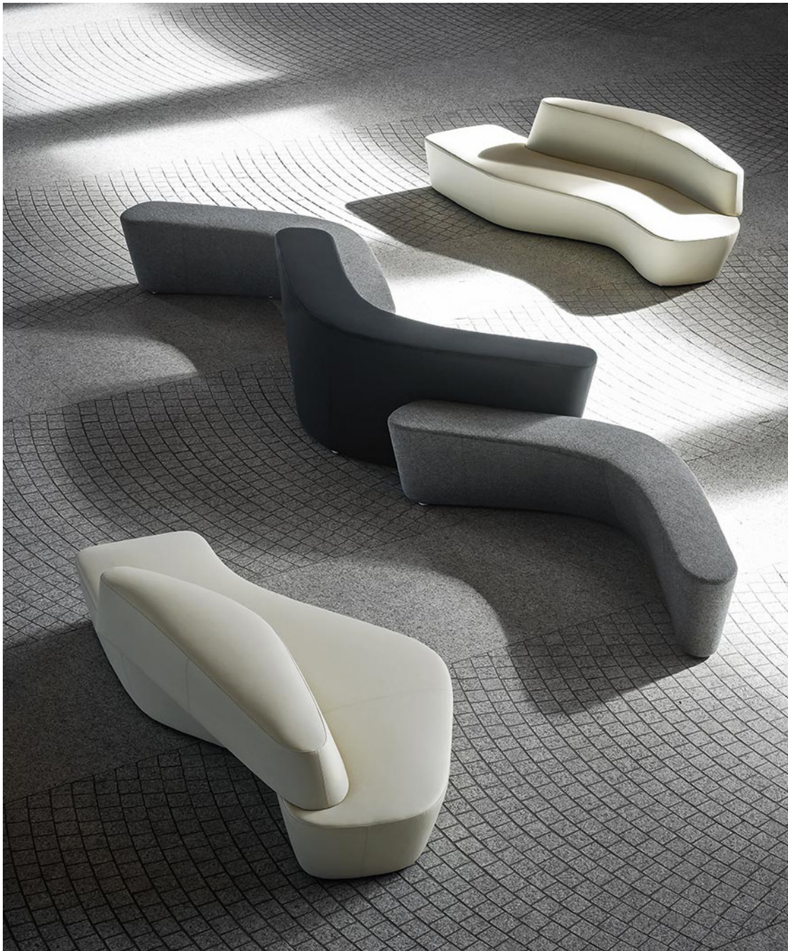
上から、MUS0132IV、MUS0133IV 中央にある3台のベンチタイプのシリーズは、P.219に掲載しています。